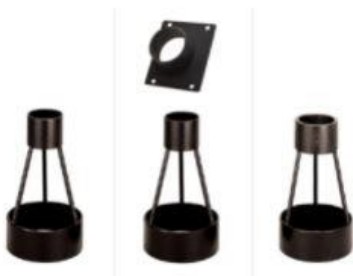
FTA-1 FTA-2A FTA-3